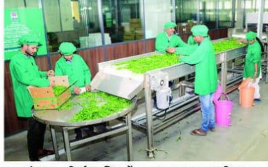
पणन मंडळाच्या निर्यात सुविधा केंद्रावर आवश्यक त्या प्रक्रिया करून भाज्यांची निर्यात केली जाते.

पुणे : देशातून आर्थिक वर्ष २०२३-२४ मध्ये २६ लाख ३५ हजार मेट्रिक टनाइतक्या भाजीपाल्याची निर्यात झाली असून त्यापोटी ८ हजार ६६९ कोटी रुपयांचे परकीय चलन प्राप्त झाले आहे. त्यापैकी महाराष्ट्रातून ८ लाख ७२ हजार मेट्रिक टन भाजीपाला निर्यात होऊन त्यातून २ हजार ५१९ कोटी रुपयांचे परकीय चलन मिळाले असून भारतीय भाज्यांची चव परदेशातील ग्राहकांच्या जिभेवर रेंगाळत आहे.